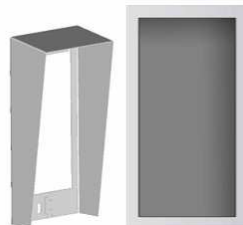
Part No. 9135361E Flush mounting box with 1-module roof Roof dimensions (WxHxD) : 129 x 240 x 41 mm Hole (WxHxD): 110 x 220 x 50mm +- 5mm